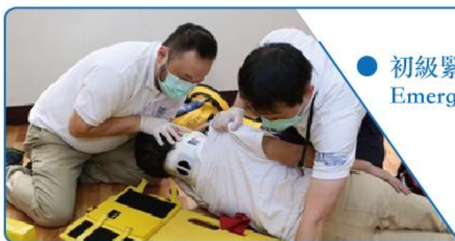
● 初級緊急救護技術員 Emergency Medical Technician 1