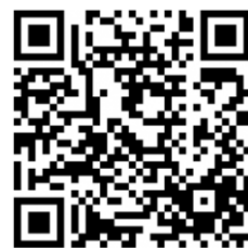
QRcode-4 中平國小新生入學資訊

線上申請繳件、報到、轉介上傳後無法再次增修，請備齊繳件資料、確認無誤後再行操作。