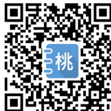
QRcode-3 線上申請、報到系統