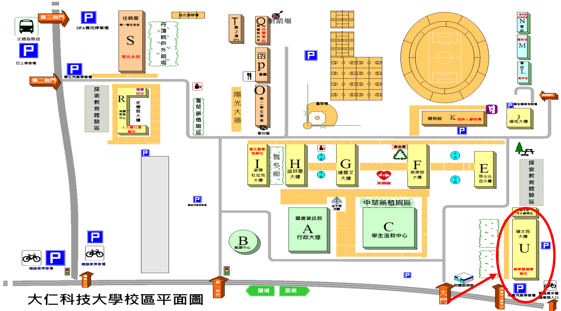
大仁科技大學校區平面圖