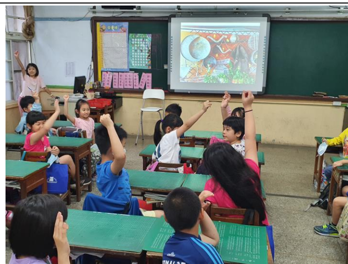
進行圖文對對碰的活動