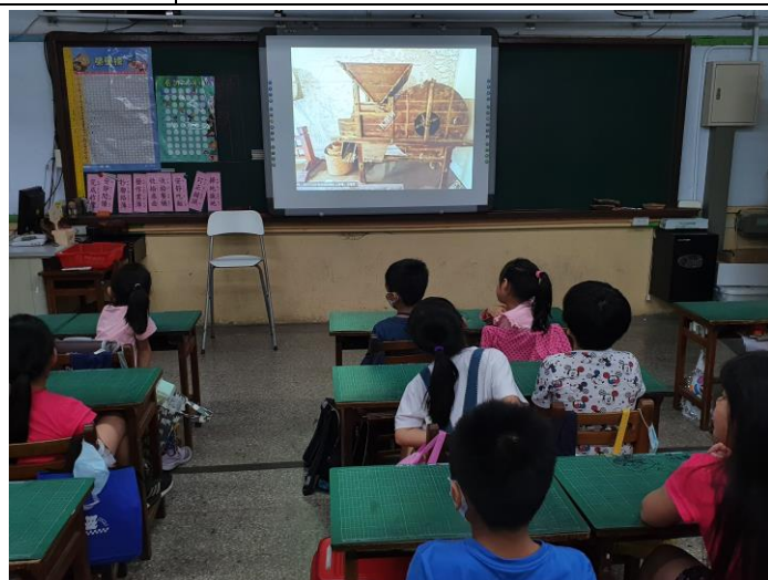
介紹客家用品(圖片教學)