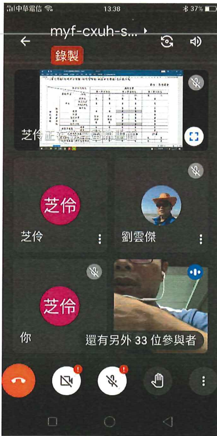
線上會議出席截圖：